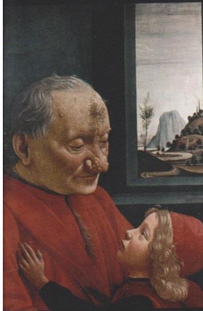
Domenico Ghirlandaio, Starzec z dzieckiem

Niezwykły pomysł artysty sprawił, że jest dzieło jest zarówno portretem, jak i martwą naturą, ułożoną w sposób przypominający ludzką sylwetkę. Widz zwraca uwagę zarówno na wygląd postaci, którego się domyśla, jak i na starannie odwzorowane owoce i warzywa.