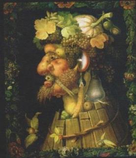
Giuseppe Arcimboldo, Jesień

Na większości portretów można oglądać piękne kobiety uznawane w swoich czasach za ideały urody, w dawnych epokach najczęściej związanej z czystością moralną, duchową i dobrem, dlatego Madonna zawsze jest na obrazach piękna.