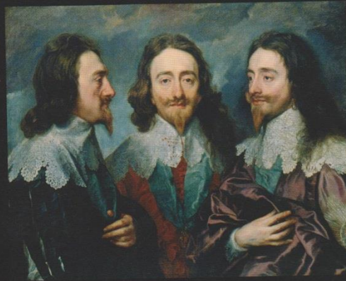
Anton van Dyck, Karol I

Rodziny portret stał się okazją do zaprezentowania kunsztu artysty zarówno w ukazywaniu starości, jak i młodości. Dwie postacie kontrastują ze sobą wiekiem i wyglądem, nasuwając rozmyślenia o upływie czasu i zmianach, które on wywołuje. Jednocześnie malarz trafnie uchwycił serdeczność między portretowanymi.