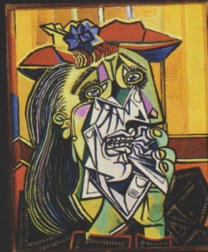
Pablo Picasso, Placząca kobieta

Współczesne portrety nie idealizują modeli. Artyści nie dodają im odświętnych strojów czy atrybutów świadczących o pozycji społecznej. Osoby na obrazach często są brzydkie czy przygnębione, skłaniają do refleksji nad sytuacją dzisiejszych ludzi.